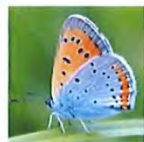
Cuivré des marais